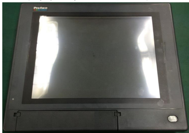
タッチパネルコンピュータ