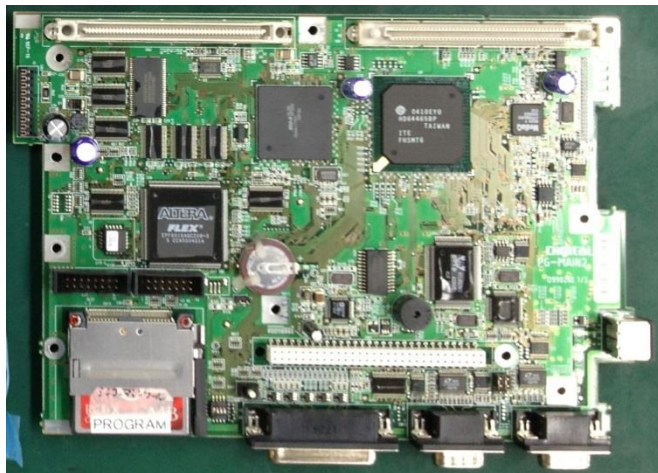
産業用マザーボード